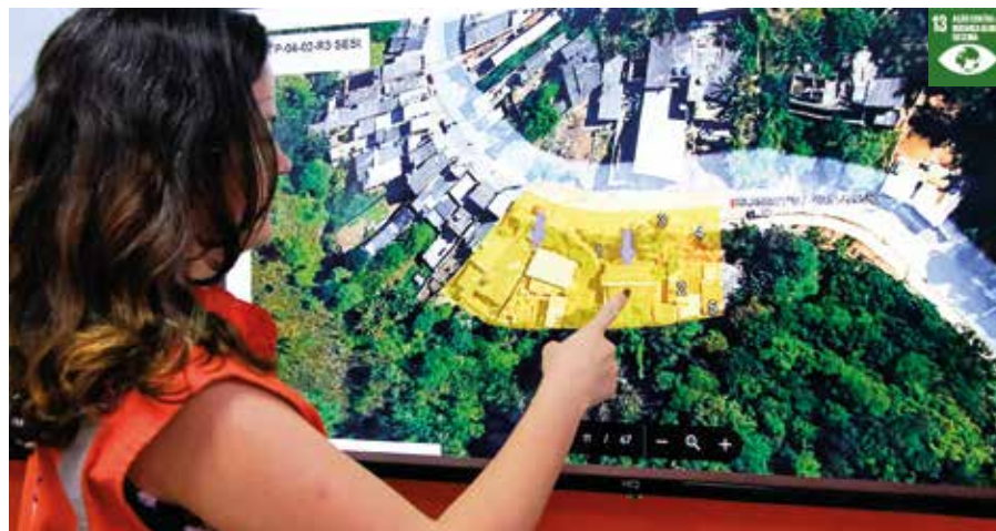
Os técnicos do instituto apontaram sugestões de intervenções

A equipe da Coordenadoria de Proteção e Defesa Civil, composta por servidores treinados pelo Instituto de Pesquisas Tecnológicas (IPT), realizou atualizações no relatório de mapeamento das áreas de risco do município. Com base no estudo produzido em parceria entre o IPT e a Prefeitura em 2021, os servidores fizeram novas imagens, cruzaram os dados e apontaram sugestões de intervenções.