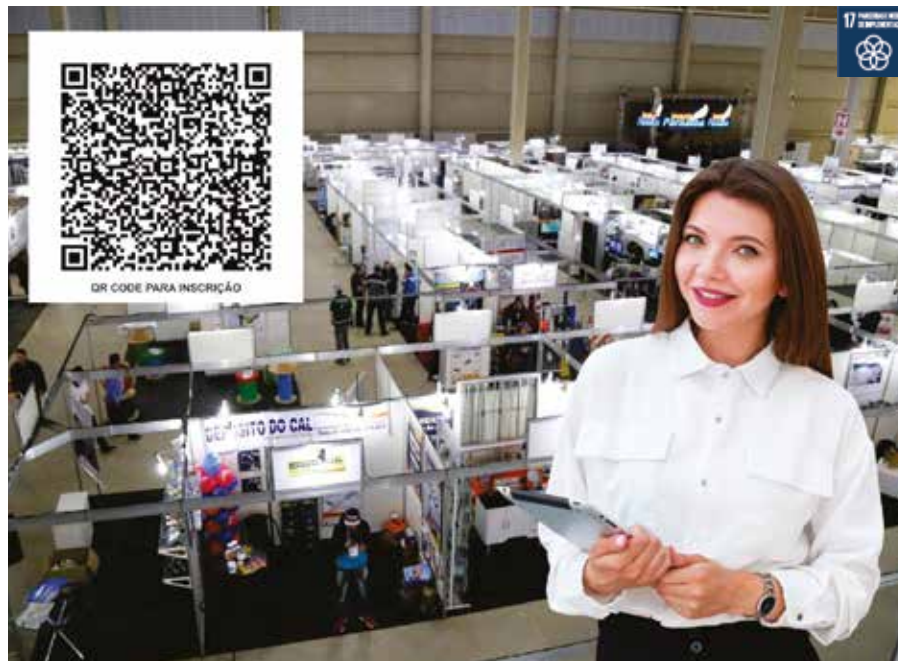
A feira acontecerá de 8 a 11 de maio, no Poupatempo

Com o intuito de promover o networking entre empresas da cidade e região, a Prefeitura de Santana de Parnaíba, por meio da Secretaria Municipal de Emprego, Desenvolvimento, Ciência, Tecnologia e Inovação (Semedes) está com inscrições abertas para empresas interessadas em participar da 5ª edição da Feira de Negócios e Empregos até o dia 30 de abril.