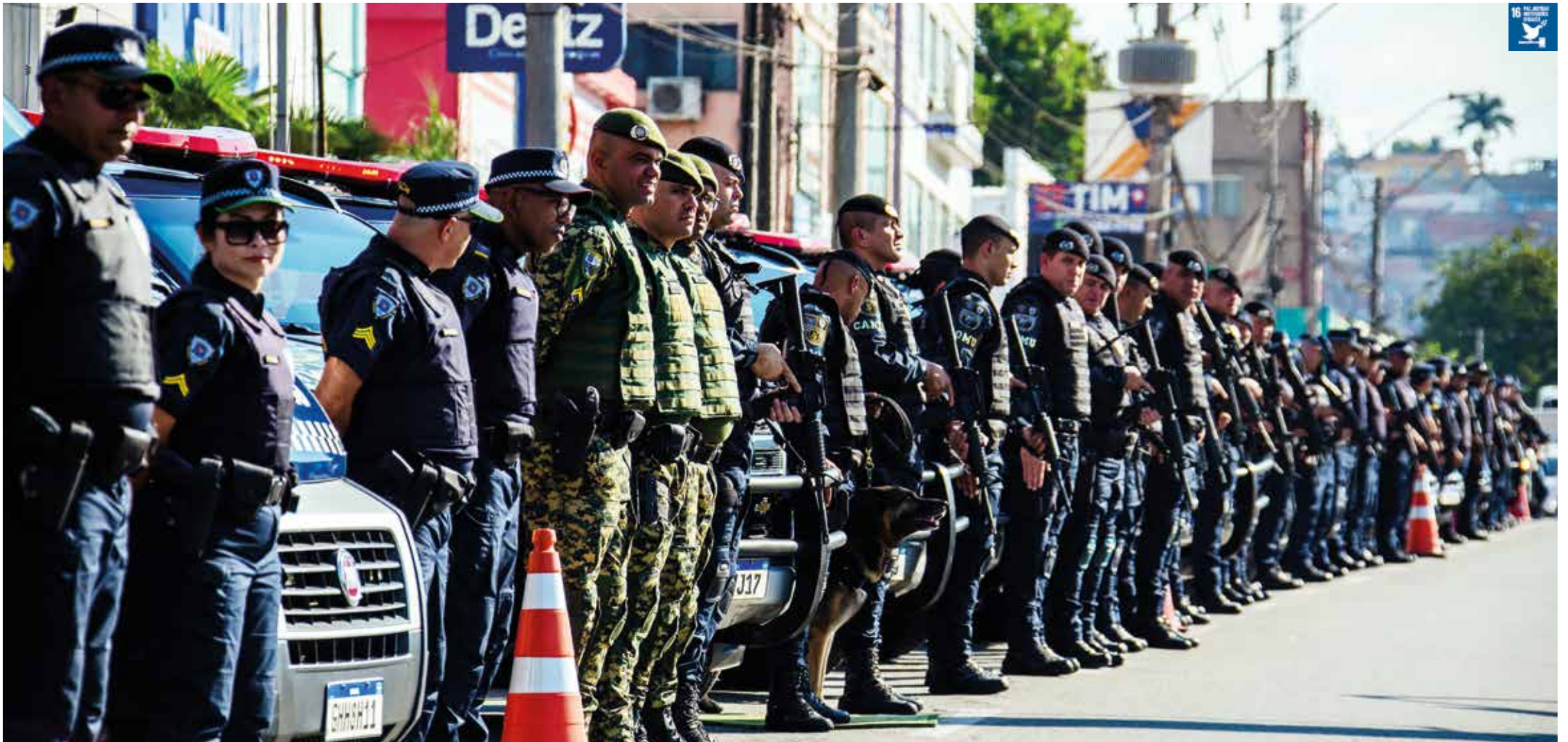
A GCM de Santana de Parnaíba é uma das mais bem equipadas do Brasil

Município reduziu índices de criminalidade e se consolidou como referência na área; entre as ações, destaque para a renovação da frota, armas modernas, novo fardamento, canil e Centro de Controle e Operações