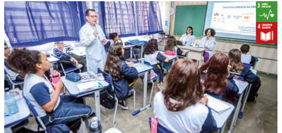
Na quinta-feira (11/4), as atividades foram concentradas no Colégio Municipal Profª Ruth de Azevedo

A Prefeitura de Santana de Parnaíba, por meio da Secretaria Municipal de Saúde (SMS), promoveu uma série de atividades de orientação e promoção da saúde nos colégios municipais. As atividades fizeram parte da Semana Saúde na Escola, que ocorreu entre segunda-feira (8/4) e sexta-feira (12/4), e atingiram cerca de 31 mil alunos da rede municipal.