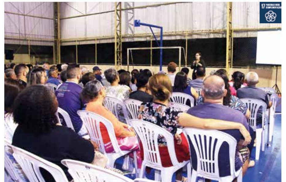
Serviço de tramitação dos documentos realizado pela prefeitura gera economia ao beneficiário

Após um intenso trabalho de pesquisa e organização para regularizar os imóveis do bairro Jaguari, a Prefeitura promoveu no dia 10 de abril a primeira reunião para esclarecimento de dúvidas sobre as etapas de regularização. O encontro realizado no Colégio Teotônio Vilela, através da Secretaria de Habitação, contou com mais de 200 dos 579 moradores a serem contemplados com a escritura.